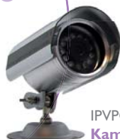
IPVPCM 510 Kamera IP 44