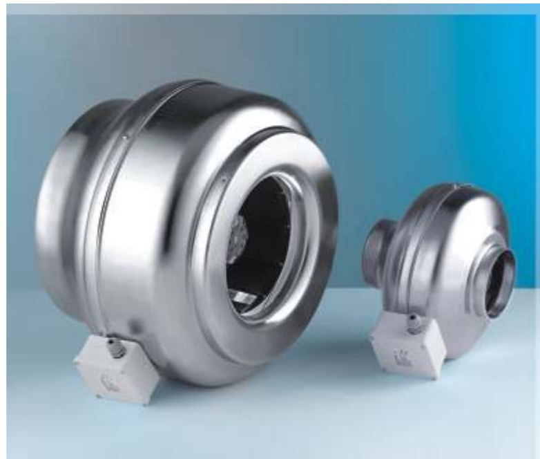
WK radiální ventilátor

WK Ø100 WK Ø125 WK Ø150 WK Ø160 WK Ø200 WK Ø250 WK Ø315